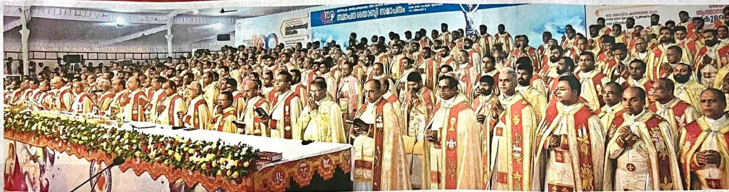
എറണാകുളം-അങ്കമാലി അതിരൂപത ശതാബ്ദിയാഘോഷങ്ങളുടെ സമാപനത്തോടനുബന്ധിച്ചു 400 വൈദികരുടെ നേതൃത്വത്തിൽ നടന്ന കുർബാന.